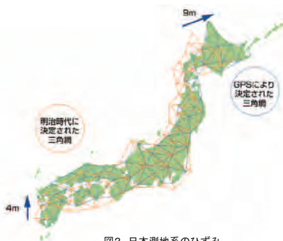
図2 日本測地系のひずみ