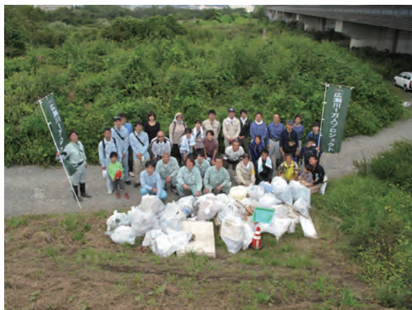
写真1 一斉清掃参加者の集合写真(2014年9月)

活動開始時の趣旨に沿って、参加会場は漂着ゴミがまだ多く残されていた流域下流部から選定するものとなりました。春の一斉清掃は開催会場が4会場に限定されていることから、支店の立地条件から参加が容易な宮沢橋会場に参加することにしました。秋の一斉清掃では参画当時、それまでの主要参加者であった学生参加者数の減少により人手不足が懸念されていた太白大橋会場へ人員を投入しました(図2)。