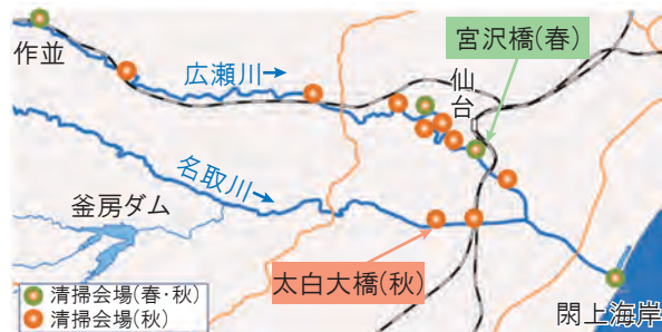
図2 広瀬川流域一斉清掃参加会場位置

各会場の運営担当は参加企業・団体に割り当てられ、当日の受付等を行います(写真2)。春の一斉清掃では、5月の連休を控えてイベントの準備が行われているなか、イベント会場となる高水敷を中心に清掃が行われました(写真3)。