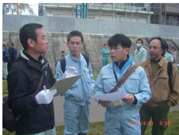
写真2 運営担当者による受付(2012年4月)

初参加以来、当社では参加会場を固定して毎回一斉清掃に参加してきました。参加は職員の任意ですが、会場への移送手段の確保や芋煮会等のイベントとの連携等、参加しやすい環境を整え、人員を確保するとともに、家族の参加を呼びかけ、自然環境の大切さを体験する場として活用しています。