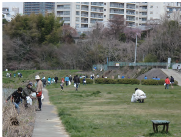
写真3 清掃活動の様子(2013年4月)

その結果、継続的な活動を維持しており、特に参加者数の少ない秋会場では、参加人員が確保できる団体(企業)となっております。