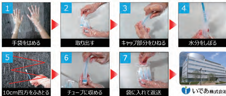
図1 検査キットによる検体採取