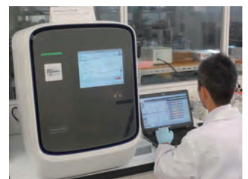
写真1 蛍光リアルタイムPCR装置によるDNA測定